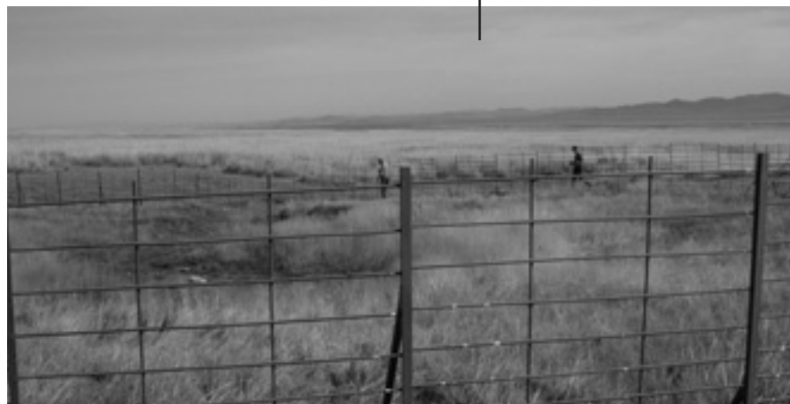
Bescherming van een bron in de Tuul-vallei

afgelopen twee jaar weinig migranten door de Tuul-vallei getrokken.