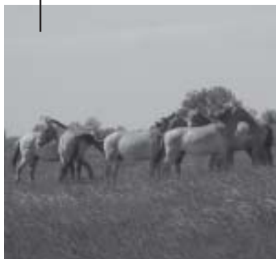
Przewalski-paarden op de Hongaarse steppe; een lust voor het oog.

goed bewaakt. In 2004 veranderde hun gebiedsgebruik in de andere seizoenen. De groepen mengden zich voor het eerst door elkaar, zelfs in de zomer. Kennelijk kunnen de hengsten elkaar wat kracht betreft goed inschatten en hebben ze nog onvoldoende gevaar te duchten van de vrijgezelle hengsten. De meeste zijn nog jong. Als jonge merries de familiegroep verlaten en aansluiting zoeken bij een hengst uit de hengstengroep vormen zich nieuwe groepen. Als de vrijgezelle hengsten ouder worden en in aantal toenemen is het te verwachten dat agressieve overnames van bestaande harems door vrijgezelle hengsten te zien zijn.