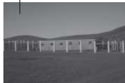
Mongoolse honden hebben lichte plekken boven de ogen waardoor het lijkt of ze vier ogen hebben.

het vee zal beperken. Dit project heeft in ieder geval wel al heel wat goodwill opgeleverd bij de herders in de directe omgeving van Hustai Nationaal Park. ■